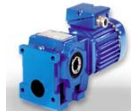
Engrane de gusano helicoidal