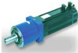
Reductor planetario "servomotor"