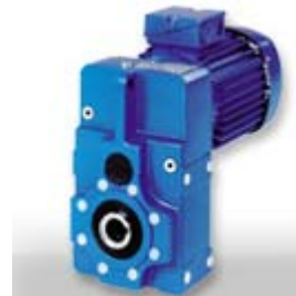
Reductor en paralelo