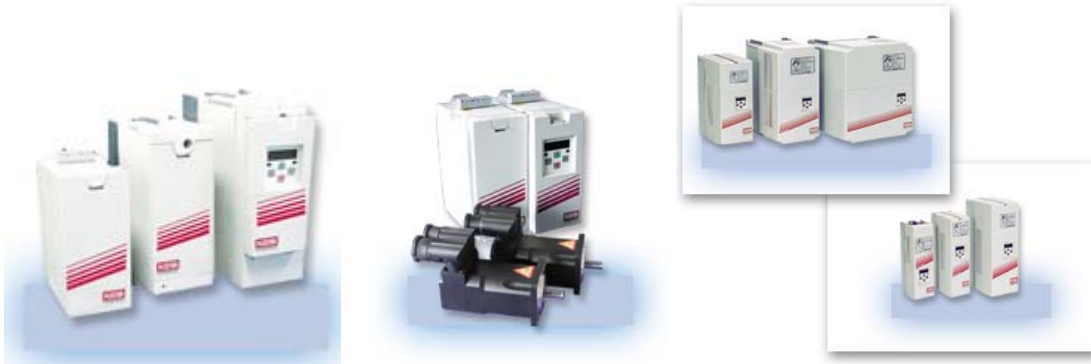
F5-basic; F5 General

Convertidores de frecuencia F5, keb combivert F5 basic, Keb combivert F5 general, Combivert F5 compact, combivert F5 version SCL, conbivert F5-A-servo, combicontrol CS, combivert F4-S, Comvibert F4-C, Combivert F4-F, Filters/choke. Disponible para motores asincronos y servomotores con diferentes alimentaciones "resolver, encoder incremental, encoder sin/cos, encoder absoluto SSI, hyperface. Frequency inverters