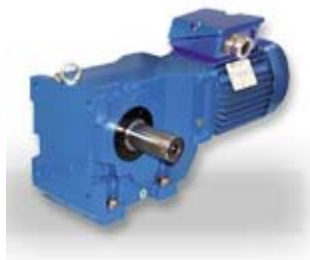
Reductores cónicos helicoidales